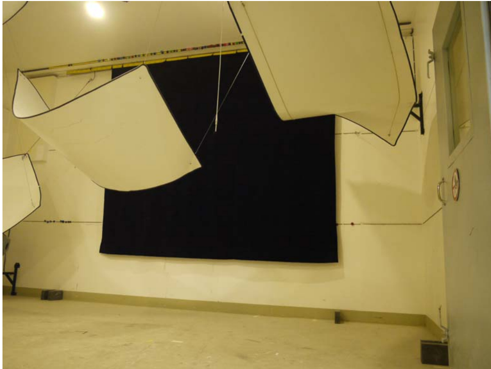
Foto B.1 Prüfaufbau im Hallraum – Vorhang glatt hängend (Aufbau 1)