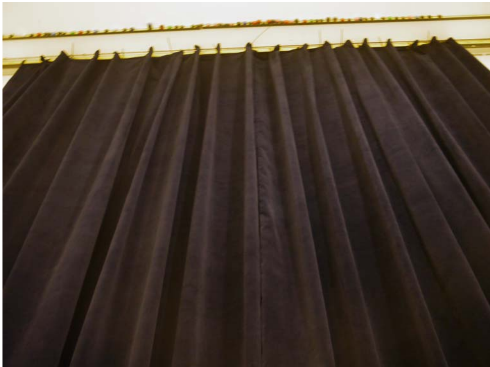
Foto B.2 Prüfaufbau im Hallraum – Vorhang mit 100% Faltenzugabe (Aufbau 2)